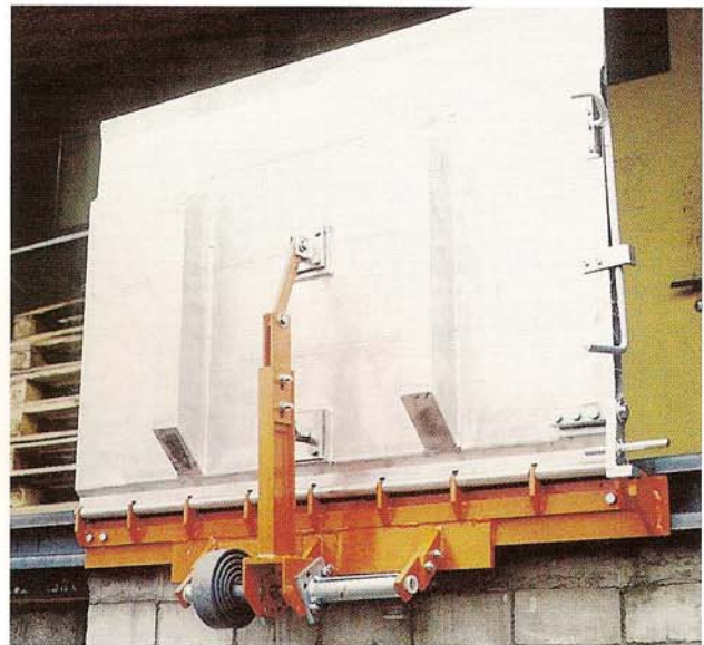
Ab einer Überfahrlänge von über 1000mm wird ein zusätzlicher Federausgleich angebaut.

Das Führungsprofil als offene Bauart sorgt stets für eine leichte Seitenverschiebbarkeit der Brücke. Die Brücke ist mit einer automatischen Fallsicherung ausgerüstet, welche in senkrechter Stellung selbsttätig einrastet.